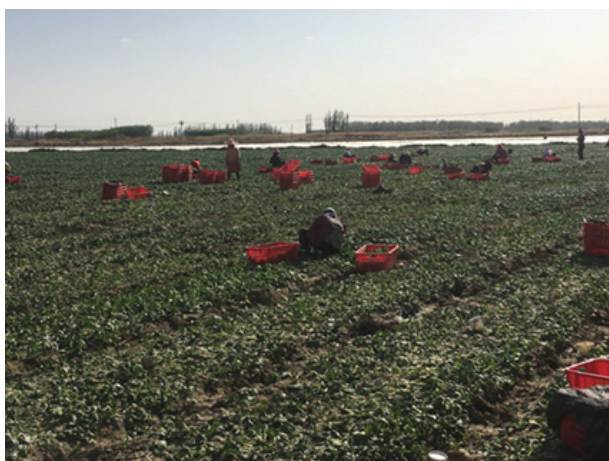
工人正在收割二季度第一批蔬菜

本集團為祥利公司在再次引進新的戰略投資者。祥利正在嘗試產品多樣化，除常見的葉菜品種外，又開闢新試驗田試種「野菜」(純天然不施加任何化學藥劑)準備投放市場；除此以外，祥利正在試種西蘭花和草菇這兩種香港連鎖速食店中最常見的蔬菜，與餐飲企業的合作事宜正穩步推進中，我們計畫將祥利打造成為香港餐飲界，特別是大型連鎖速食企業的優質蔬菜供應商。