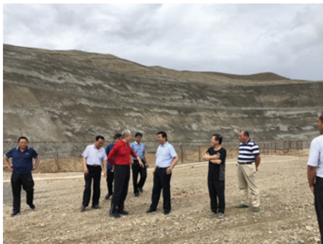
西北電建有望成為星亮礦項目的工程EPC總承包商

2018年6月，中國能源建設集團西北電力建設工程有限公司（「西北電建」）團隊受邀考察星亮礦專案，亦與星亮礦的管理團隊進行現場交流。通過對現場環境和資料的仔細論證分析，與會人員一致看好星亮煤礦未來的發展前景，項目的主要優勢集中在：