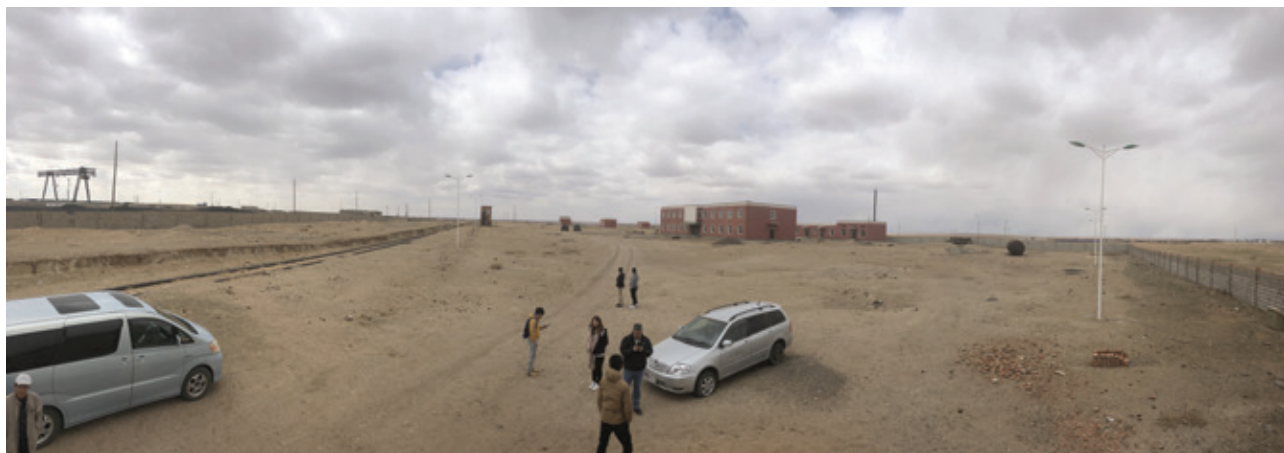
專業團隊項目現場盡調