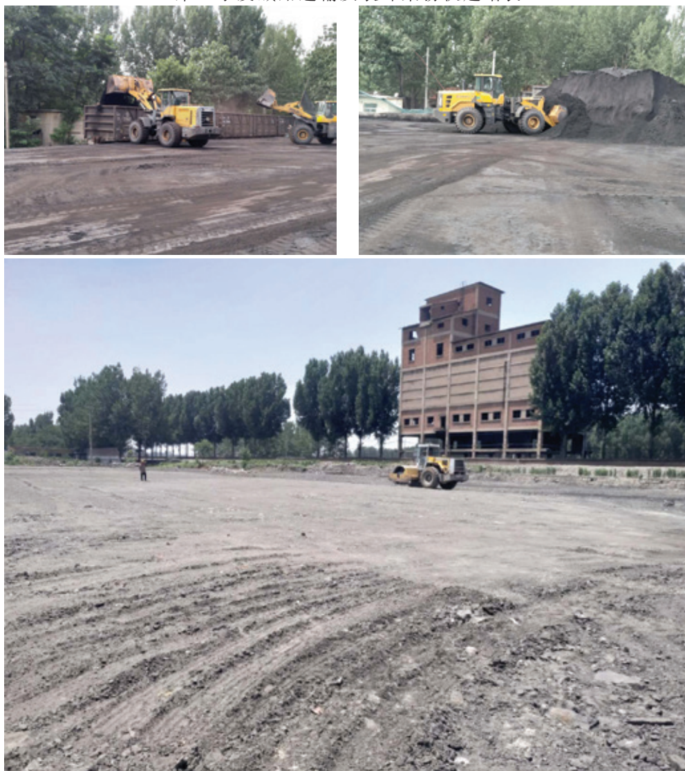
煤炭物流園二期新平整土地