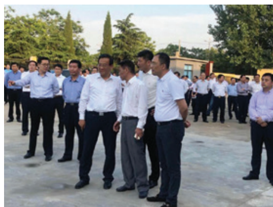
滕州市委書記邵士官聽取凱源管理層介紹公司運營情況並指導工作